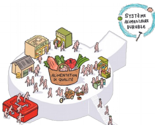
Table-ronde sur l'alimentation durable

Lors de ce déplacement à Montpellier, il a également rencontré le Comité Local de l'Alimentation : 50 habitants réunis pour se former et débattre sur les enjeux de démocratie dans l'initiative de Caisse Alimentaire Commune.